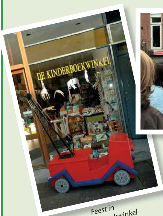
Feest in De Kinderboekwinkel

Wist je dat de Kinderboekenweek al meer dan 65 jaar bestaat?